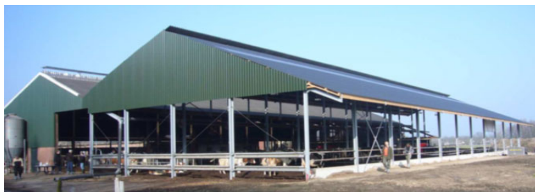
Figur 2. Kompoststald hos Wim Lubbersen er etableret parallelt med eksisterende sengestald. Teknikkassen til højre for stalden indeholder blæser og ventilsystem der muliggør skift mellem indblæsning og udsugning gennem komposten via rørsystem i gulvet.

I gulvet under stalden hos Wim Lubbersen , (Bijvanksweg 1a, 7451 KN Holten, besøgt 15. april 2012) er monteret et rørsystem til enten luftindblæsning eller udsugning via komposten. Stalden er etableret som en tilbygning parallelt med en eksisterende sengestald således at køerne i den nye stald har adgang til den ene side af foderbordet i den eksisterende stald, se figur 2.