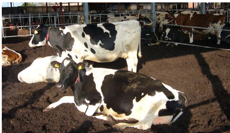
Figur 3. Selv om komposten virkede forholdsvis fugtigt var den ikke særlig tilbøjelig til at klæbe og køre så overraskende rene ud.

Kompostarealet er 13 meter bredt og 53 meter langt, svarende til ca. 690 m 2 . Da vi besøgte stalden var der 50 køer som hver havde adgang til et kompostareal på ca. 12.5 m 2 . Stalden blev taget i brug i julen 2011 og ved etableringen af komposten blev det tilstræbt at lette luftstrømningen i komposten ved at lægge grov træflis i bunden. Indtil vore besøg var der anvendt ca. 800 m 3 flis i alt. Materialet i stalden virkede noget fugtigt og det så ikke ud som om køerne var særligt ivrige efter at lægge sig i komposten. Uanset at komposten virkede fugtigt var den ikke særlig tilbøjelig til at klistre og køerne forekom overraskende rene – se figur 3. Temperaturen i kompostmåten var omkring 30 °C.