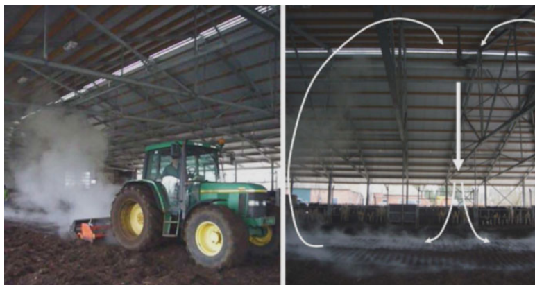
Figur 1. Til venstre; varm kompost damper voldsomt ved bearbejdning. Til højre; nedadrettet luftstrøm fjerner damp umiddelbart under blæser. Få meter fra den nedad gående luftstrøm fører returstrømningen dampen mod loftet.

Ammoniakkoncentrationen (med Kitagave detektionsrør) målte i dampen under en jakke der var lagt ud på den dampende kompost. Den målte koncentration var omkring 0.5 ppm. Temperaturer i komposten var 50-60 °C og således viser målingen at relativ høj temperatur i komposten ikke nødvendigvis fører til stor ammoniakemission.